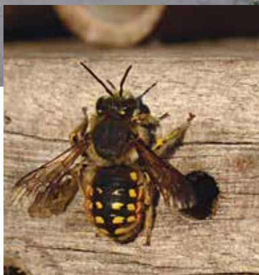
Een bijenhotel in Nijmegen.

hotels grotendeels of zelfs geheel leegstaan. De kosten zijn hoog en het levert niet meer op dan een van gaten voorzien houtblok ergens in een achtertuin.