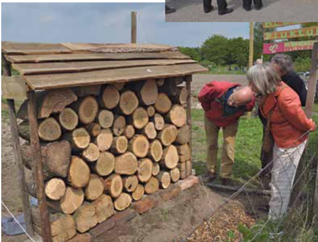
In Wageningen werd ook een bijenhotel geopend.